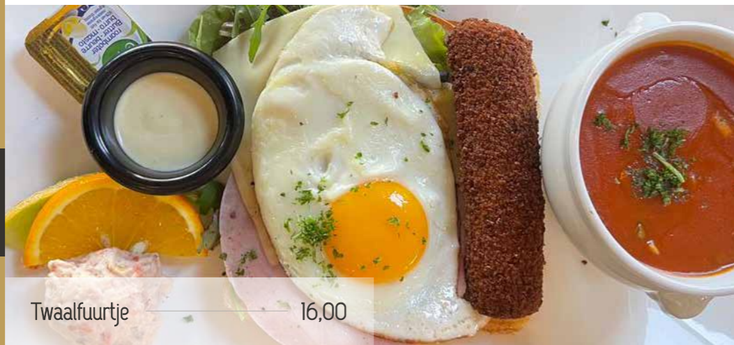
Twaalfuurtje ——— 16,00